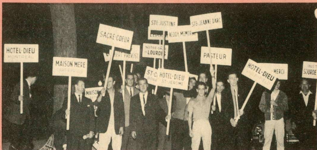
1964 — Négociation régionale dans les hôpitaux du Grand Montréal. Les principales revendications étaient l'uniformisation des conventions collectives, le rétrécissement des écarts de salaires entre travailleurs et travailleuses, la diminution des heures de travail, etc. C'est une grève de six heures qui a permis le règlement de la convention collective.

1930 et 1931 auront été pour les travailleurs de notre province, comme du reste pour ceux de tout le pays et même du monde entier, deux années de tristesse, d'inquiétude, voire même d'angoisse. La crise économique qui sévit par le monde depuis l'automne 1929 devait normalement se faire sentir plus rude, plus âpre pour les travailleurs manuels que pour toute autre classe de la société. Cultivateurs et ouvriers, plus ceux-ci que ceux-là, ont été les premiers atteints, en raison de la faiblesse de leurs réserves financières et de leur dépendance étroite des phénomènes de production et de consommation. Certes oui, toutes les classes de la société ont eu à souffrir