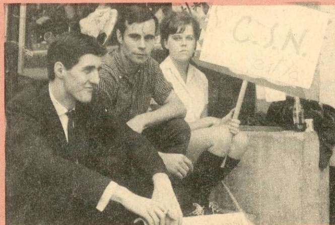
1963 — Lock-out de 10 semaines des propriétaires du quotidien La Voix de l'Est de Granby. Ce geste répressif survient après la fondation du syndicat. Ces travailleurs luttaient syndicalement pour améliorer leurs conditions de travail. Ils ont obtenu gain de cause.

leur position et plus que jamais, en remplissant leur rôle naturel, qui est la protection des intérêts professionnels de leurs membres. Nous ne voulons pas paraître indûment optimiste sachant que le chômage a frappé ferme dans nos rangs; souvent dans un syndicat déterminé, 25% des membres étaient en chômage. Mais nous avons tenu à déclarer que le Syndicat, en temps de crise, est encore plus utile à ses membres qu'en temps de prospérité.