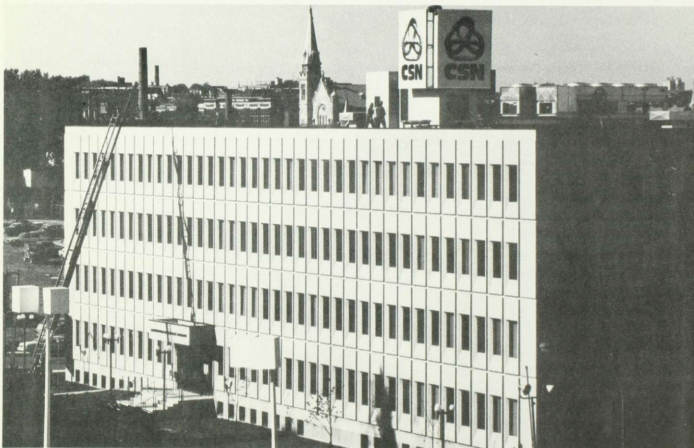
L'édifice du siège social de la CSN, situé au 1601 de Lorimier à Montréal (coin Maisonneuve). Le numéro de téléphone pour nous rejoindre est 286-2283.