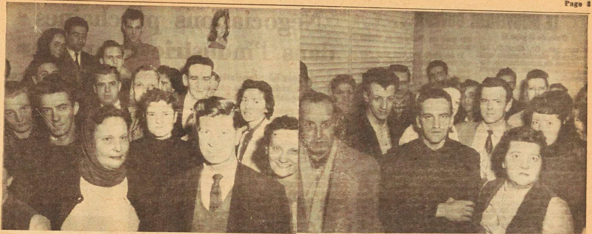
Photo prise la semaine dernière au moment où les grévistes de Rosita Hosiery de Montréal apprenaient que l'employeur se disait disposé à reconnaître leur syndicat. Le retour au travail ne se fera qu'après la signature d'une convention collective de travail.