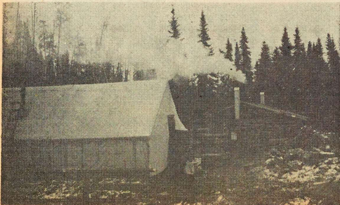
Le campement du chantier