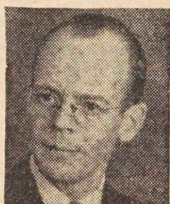
GERARD PICARD, président de la Confédération des Travailleurs Catholiques du Canada, Inc.