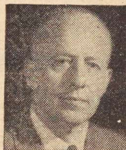
FRANK H. HALL, président General Conference Committee of the Standard International Railway Labour Organizations