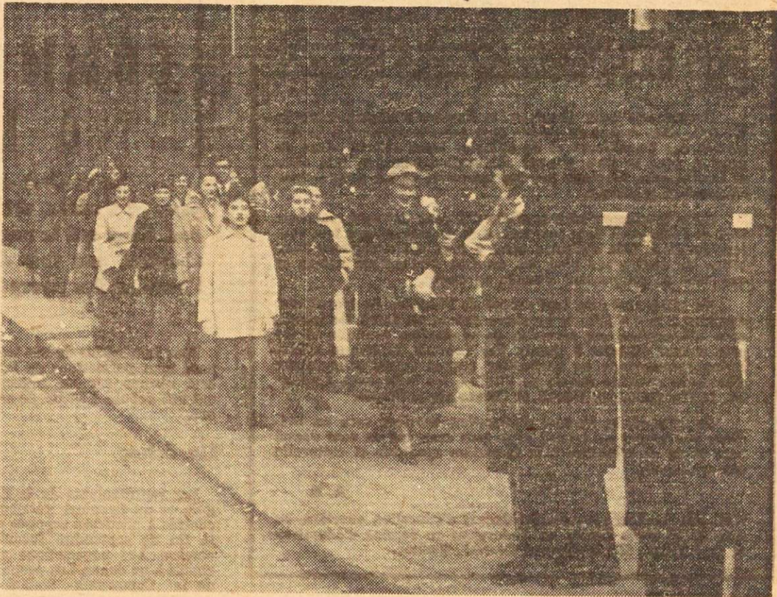
Comme de bien entendu, la police est arrivée en même temps que les grévistes sur la ligne de piquetage de la Grover Mills — Marvin Hosiery. Cela, comme le montre notre vignette, n'a pas empêché les ouvriers d'afficher leur plus beau sourire...