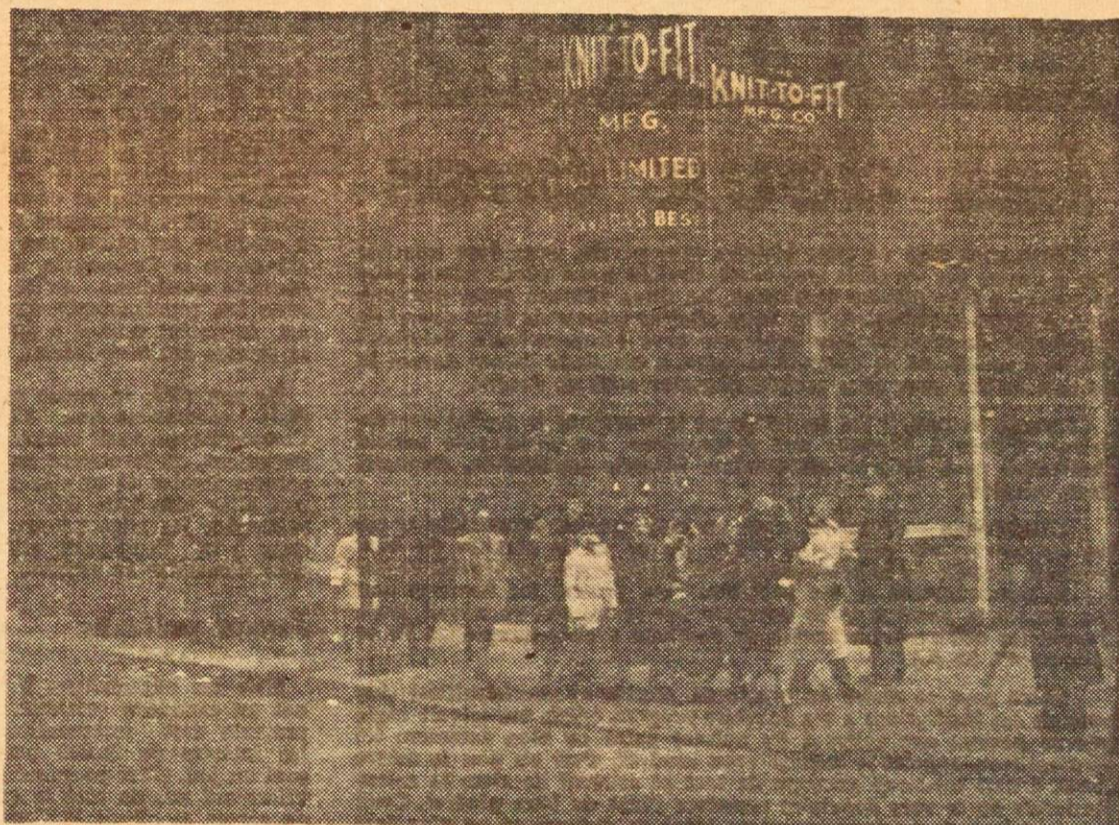
... ni d'exprimer leur protestation en face de l'immeuble où logent les ateliers des deux compagnies. Depuis, en vertu d'une entente avec les agents, vingt-cinq piqueteurs et piqueteuses gardent chacune des entrées de l'usine. Pour combien de temps? C'est le secret de M. Grover. Pour leur part, les grévistes attendent qu'il se décide à signer...